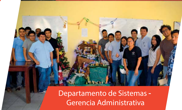
Departamento de Sistemas - Gerencia Administrativa