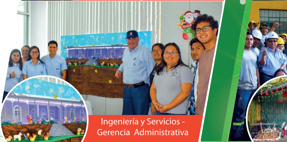
Ingeniería y Servicios - Gerencia Administrativa