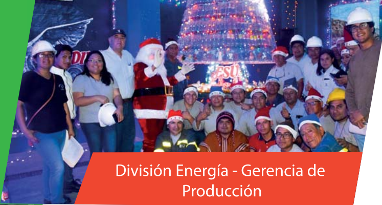
División Energía - Gerencia de Producción