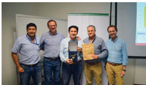
MEJORES RESULTADOS COSECHA - LA TRONCAL