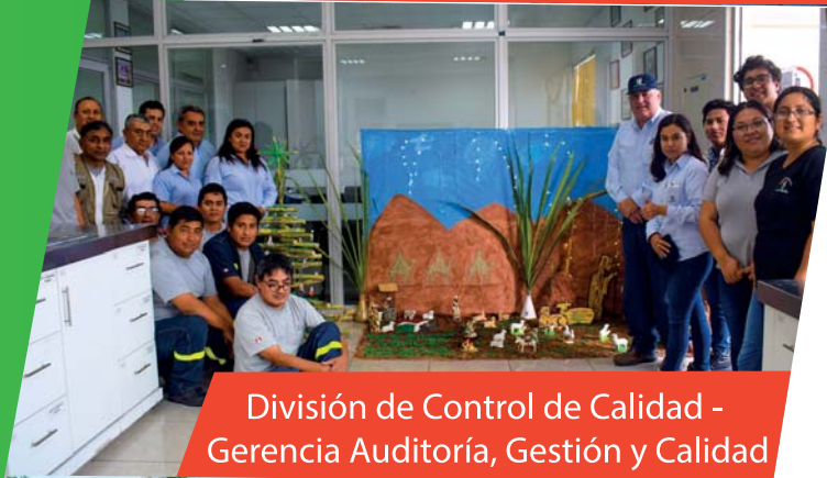
División de Control de Calidad - Gerencia Auditoría, Gestión y Calidad