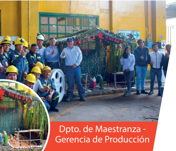
Dpto. de Maestranza - Gerencia de Producción