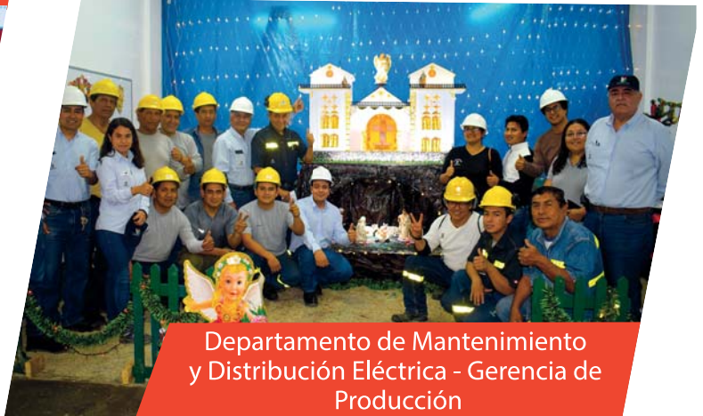
Departamento de Mantenimiento y Distribución Eléctrica - Gerencia de Producción