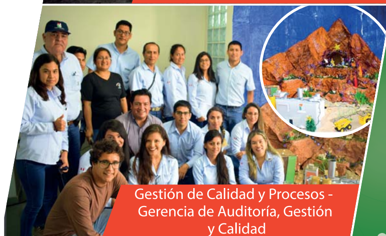
Gestión de Calidad y Procesos - Gerencia de Auditoría, Gestión y Calidad