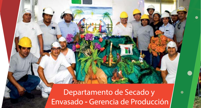
Departamento de Secado y Envasado - Gerencia de Producción