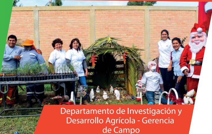
Departamento de Investigación y Desarrollo Agrícola - Gerencia de Campo