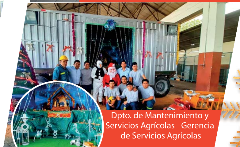
Dpto. de Mantenimiento y Servicios Agrícolas - Gerencia de Servicios Agrícolas