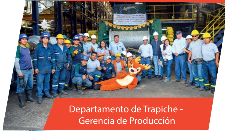
Departamento de Trapiche - Gerencia de Producción