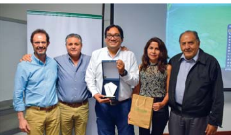
PROFESIONAL DE AÑO ÁREA AGRÍCOLA - AGROAURORA