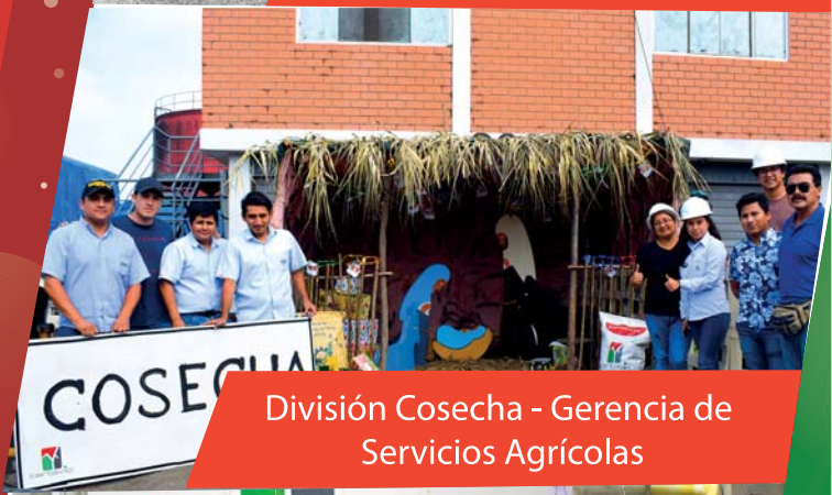
División Cosecha - Gerencia de Servicios Agrícolas