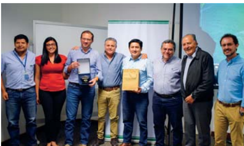
MEJORES INICIATIVAS AGRÍCOLAS - LA TRONCAL