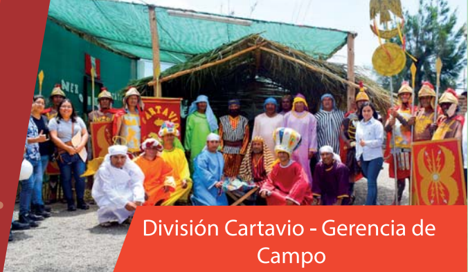
División Cartavio - Gerencia de Campo