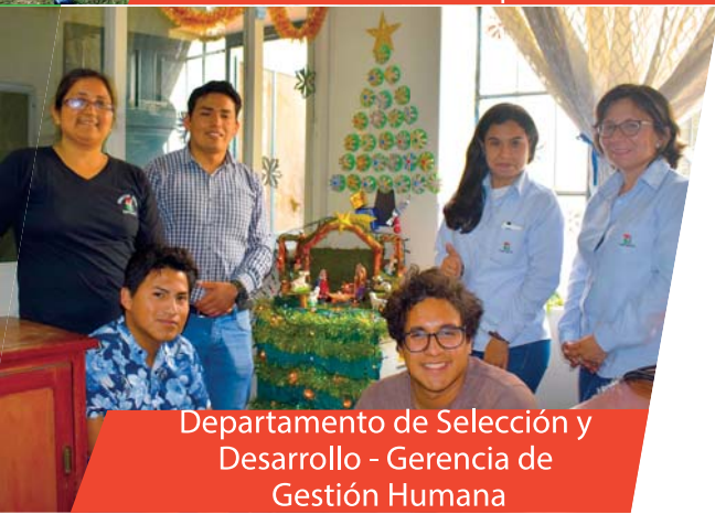
Departamento de Selección y Desarrollo - Gerencia de Gestión Humana