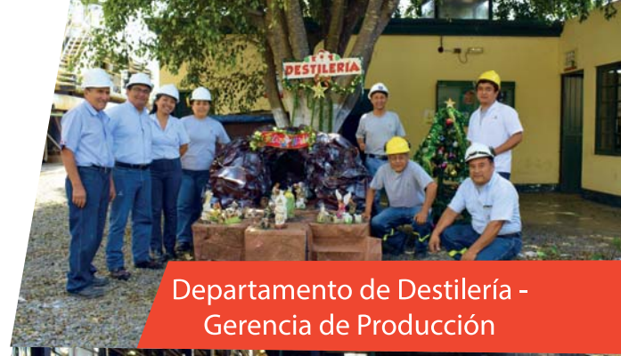
Departamento de Destilería - Gerencia de Producción