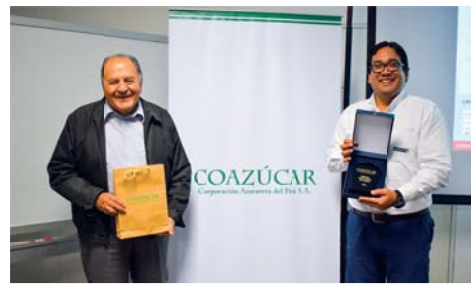
MEJORES RESULTADOS EN CAMPO - AGROAURORA